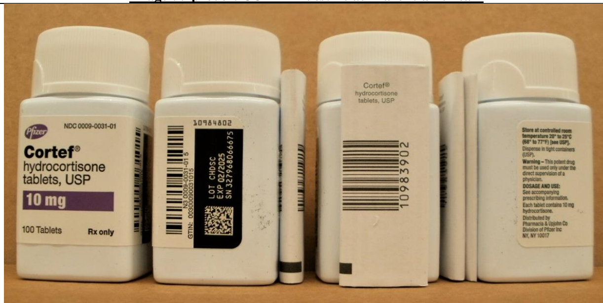
Image du produit CORTEF destiné au marché américain